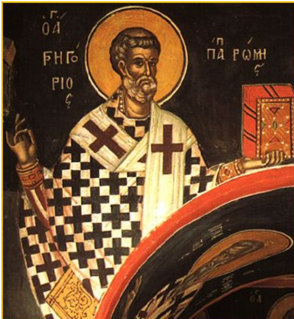
Griechisches Bild Gregors