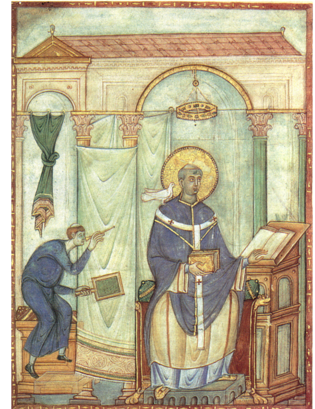
„Gregorblatt“ (um 985), Trier, Stadtbibliothek, Hs. 171/1626

20.–22. September 2024 Universität Zürich