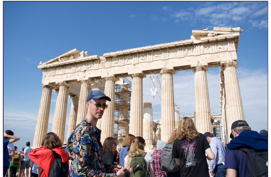
Exkursion Athen FS23: Ausflug auf die Akropolis